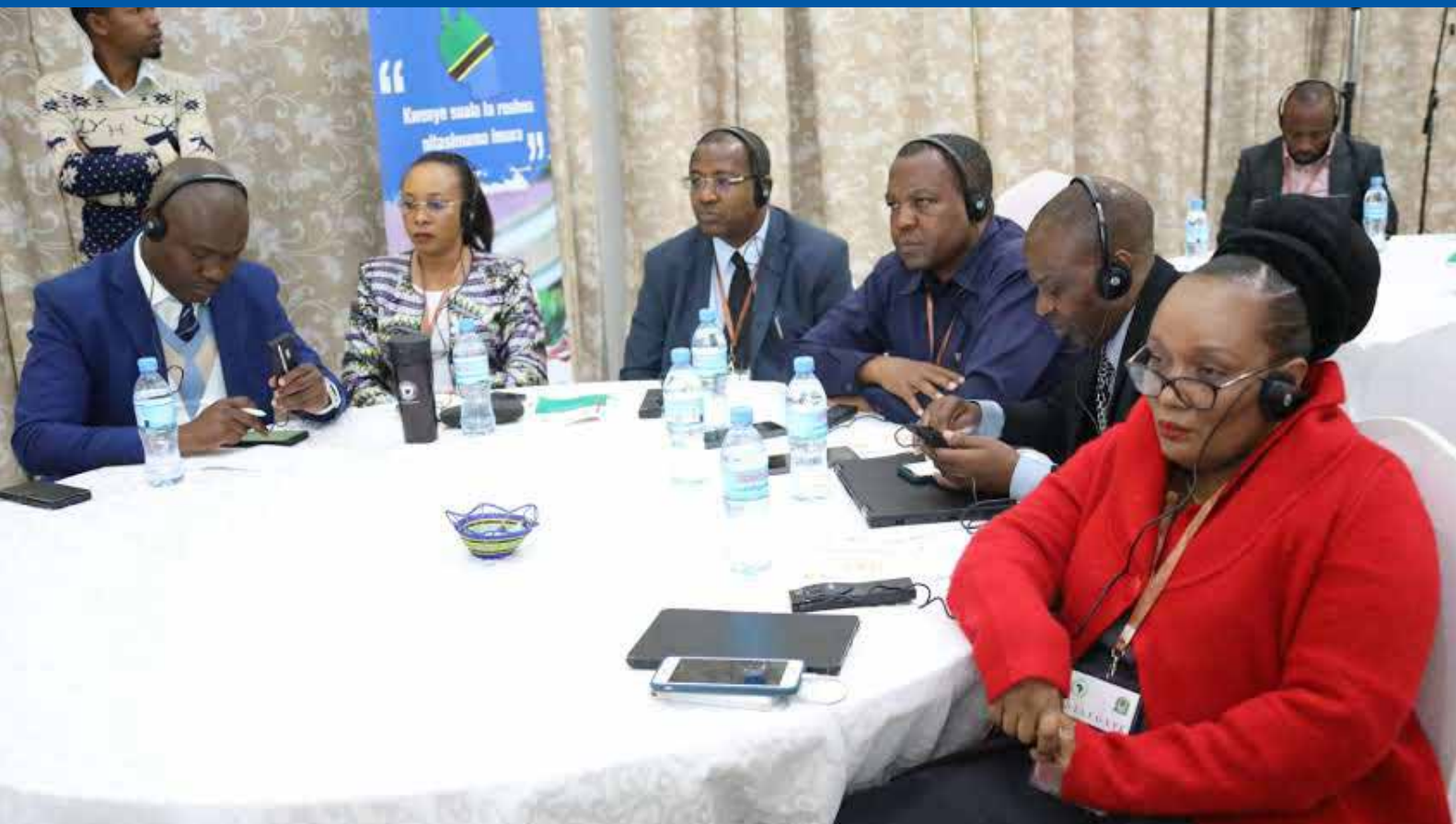
Baadhi ya Wakurugenzi wa TAKUKURU wakifuatilia uwasilishaji wa mada wakati wa kongamano la maadhimisho ya Siku ya Mapambano Dhidi ya Rushwa barani Afrika katika ukumbi wa Lake Nyasa wa AICC jijini Arusha Julai 10, 2023.