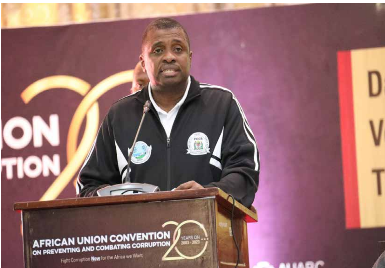
Makamu wa Pili wa Rais wa Zanzibar Mhe. Hemed Suleiman Abdulla akihutubia kufungua maadhimisho ya Siku ya Mapambano Dhidi ya Rushwa barani Afrika jijini Arusha Julai 9, 2023

“Leo tumeamka mapema kwa ajili ya kazi hii, kuunga mkono juhudi za Watanzania wote pamoja na viongozi