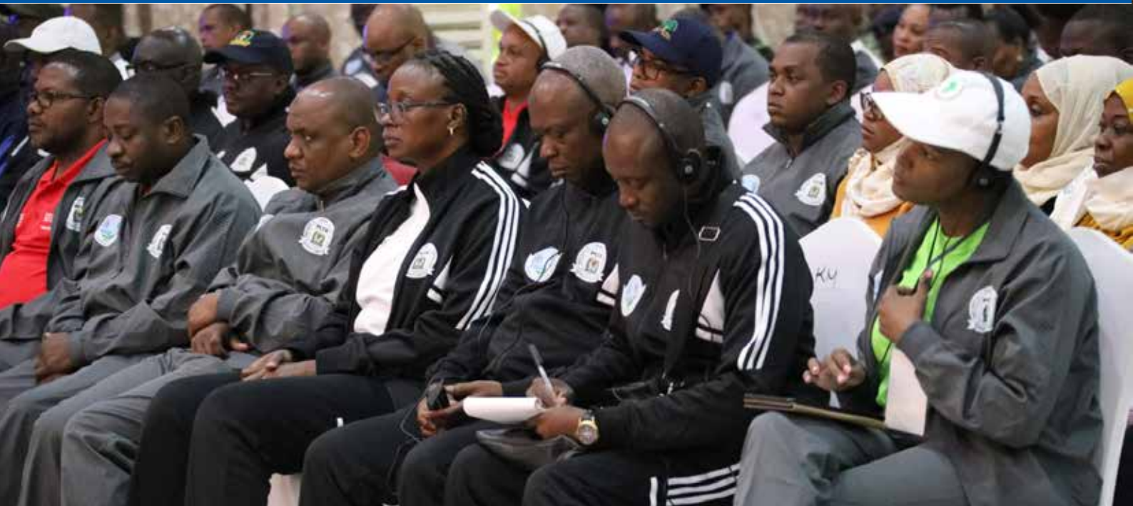
Baadhi ya washiriki wakimsikiliza mgeni rasmi Makamu wa Pili wa Rais wa Zanzibar Mhe. Hemed Suleiman Abdulla (hayupo pichani) wakati anafungua maadhimisho ya Siku ya Mapambano Dhidi ya Rushwa barani Afrika katika ukumbi wa Lake Nyasa wa wa AICC jijini Arusha Julai 9, 2023.