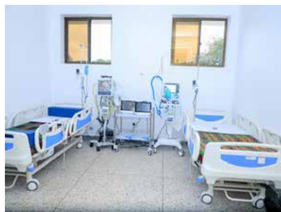
Picha ya vifaa tiba vilivyounuliwa na Serikali kwa ajili ya moja ya hospitali zinazotoa huduma kwa umma.

"Pamoja na dosari za hapa na pale, tumefanya na tutaendelea kufanya vizuri zaidi katika matumizi ya fedha za umma na kuongeza uwazi na kuimarisha mapambano dhidi ya rushwa," aliahidi Rais Samia. ✍️