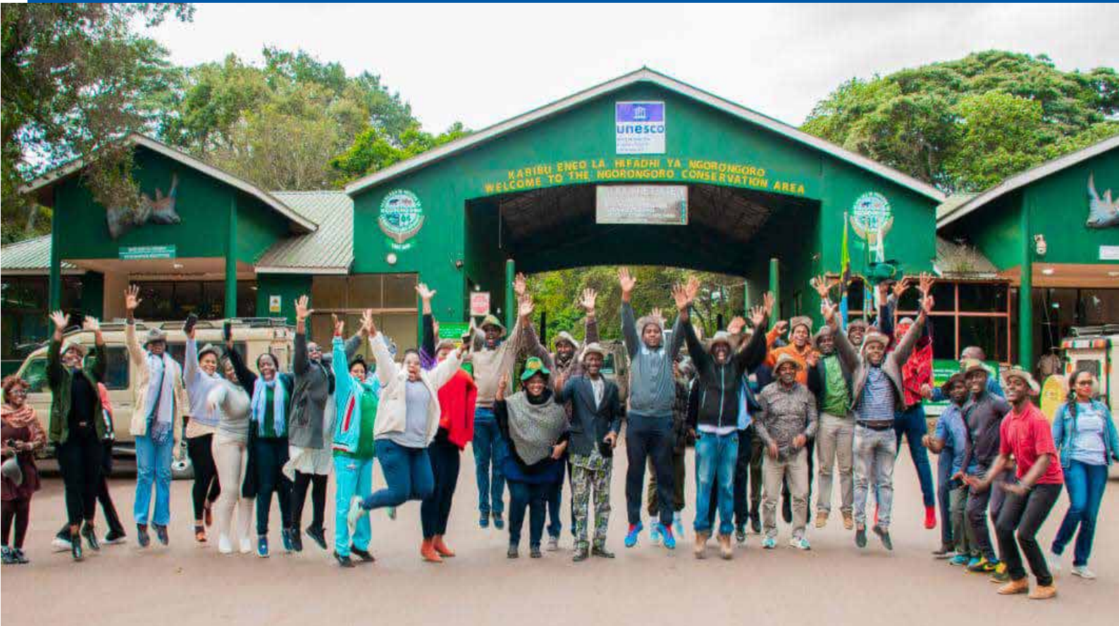
WAITIKIA WITO WA RAIS SAMIA: Baadhi ya washiriki wa maadhimisho ya Siku ya Mapambano Dhidi ya Rushwa barani Afrika wakiwa katika lango kuu la kuingia Hifadhi ya Taifa ya Ngorongoro, mkoani Arusha Julai 13, 2023 kwa ajili ya utalii.