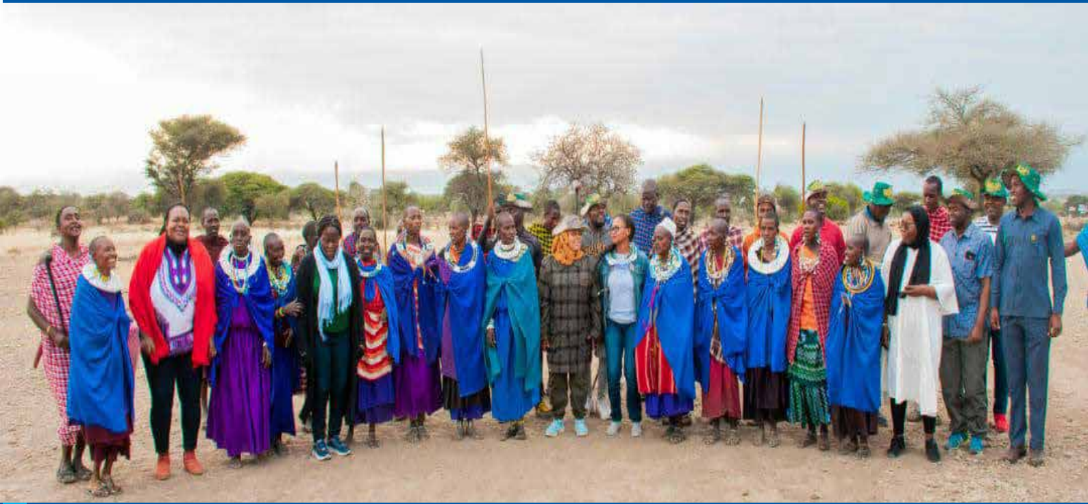
'ROYAL TOUR': Baadhi ya washiriki wa maadhimisho ya Siku ya Mapambano Dhidi ya Rushwa barani Afrika waki-piga picha na wanajamii ya Kimaasai wanaoishi Hifadhi ya Taifa ya Ngorongoro, mkoani Arusha Julai 13, 2023.