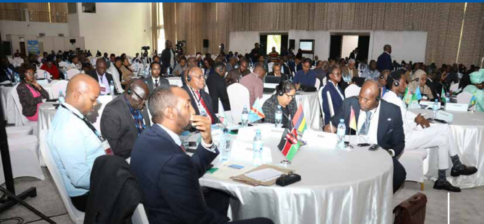
Baadhi ya washiriki wakifuatilia majadiliano katika Kongamano la maadhimisho ya Siku ya Mapambano Dhidi ya Rushwa barani Afrika katika ukumbi wa Lake Nyasa wa AICC jijini Arusha Julai 10, 2023