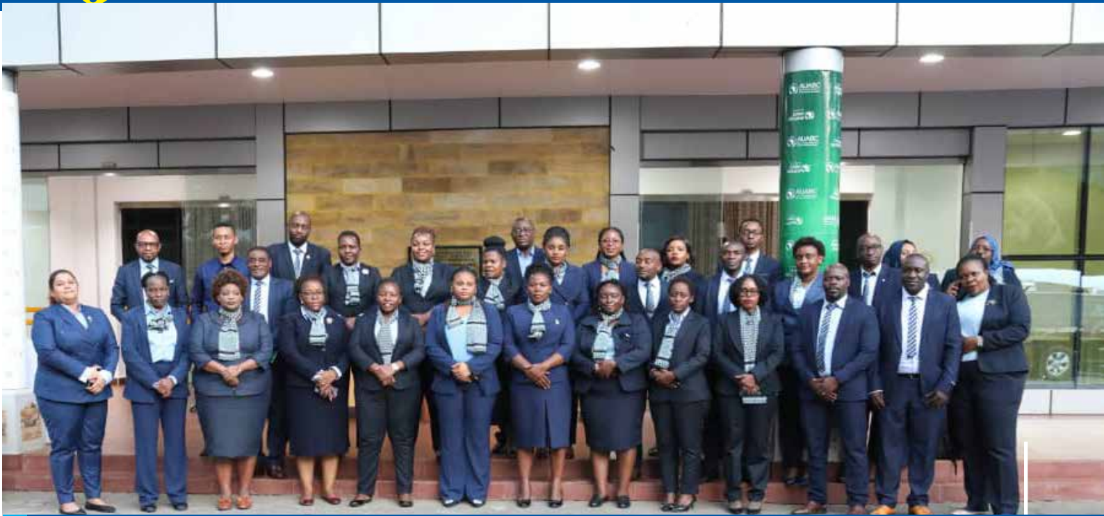
Wajumbe wa Kamati ya Maandalizi ya Maadhimisho ya Siku ya Mapambano Dhidi ya Rushwa barani Afrika wanaojumuisha watumishi wa ZAECA na TAKUKURU wakiwa katika picha ya kumbukumbu mbele ya ukumbi wa Lake Nyasa wa AICC jijini Arusha Julai 10, 2023.