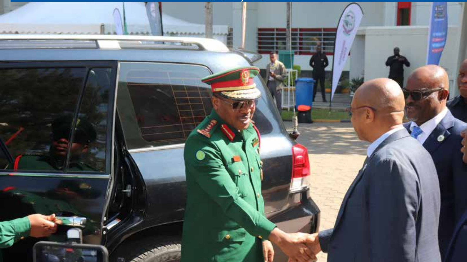
Mkuu wa Majeshi ya Ulinzi na Usalama nchini, Jenerali Jacob John Mkunda akiwasili katika viwanja vya AICC jijini Arusha wakati wa kilele cha maadhimisho ya Siku ya Mapambano Dhidi ya Rushwa barani Afrika Julai 11, 2023.