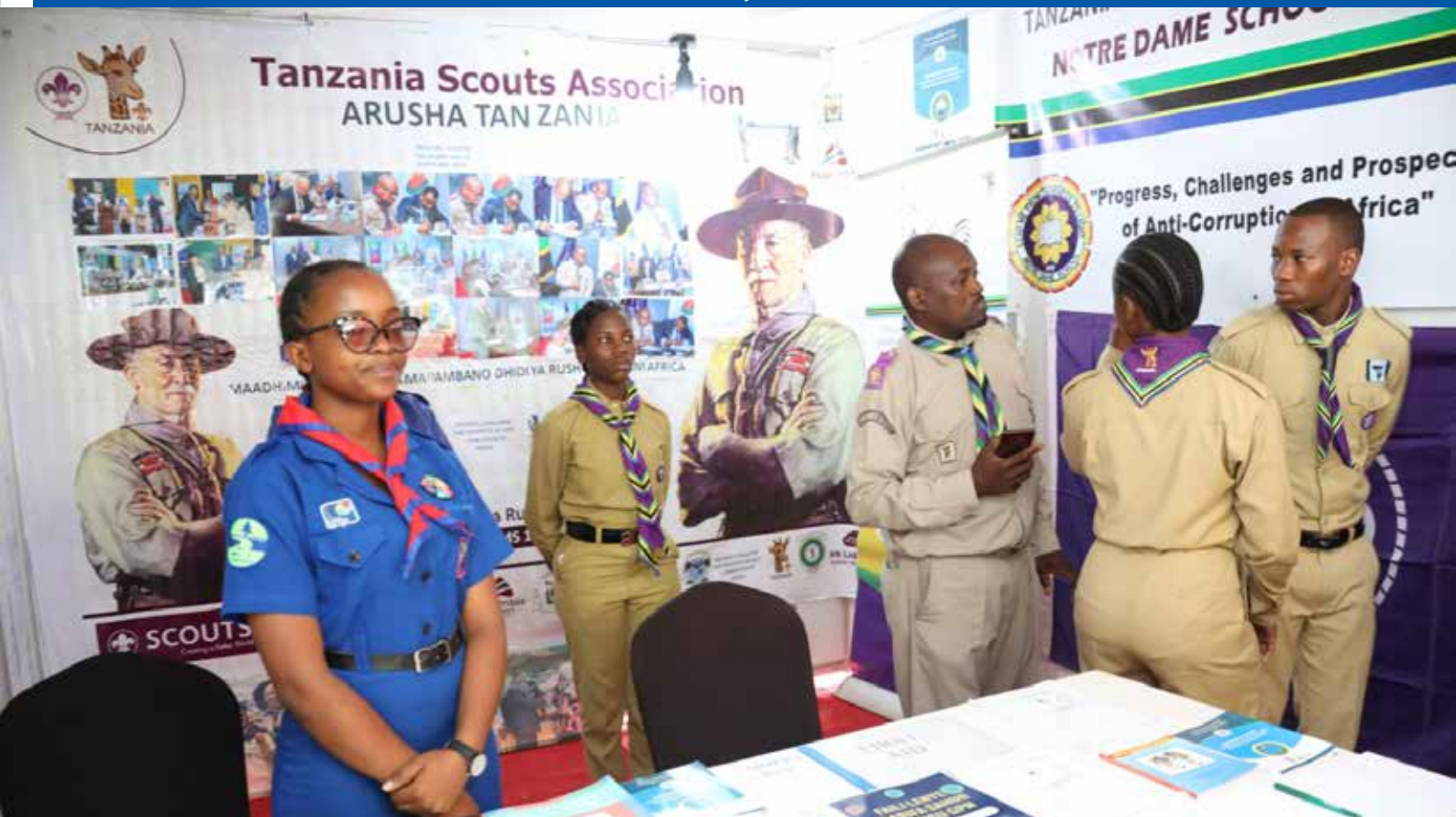
Vijana wa Skauti na Girl Guide wakiwa katika banda la Tanzania Scouts Association (TSA) kwenye maonesho ya maadhimisho ya Siku ya Mapambano Dhidi ya Rushwa barani Afrika Julai 10, 2023.