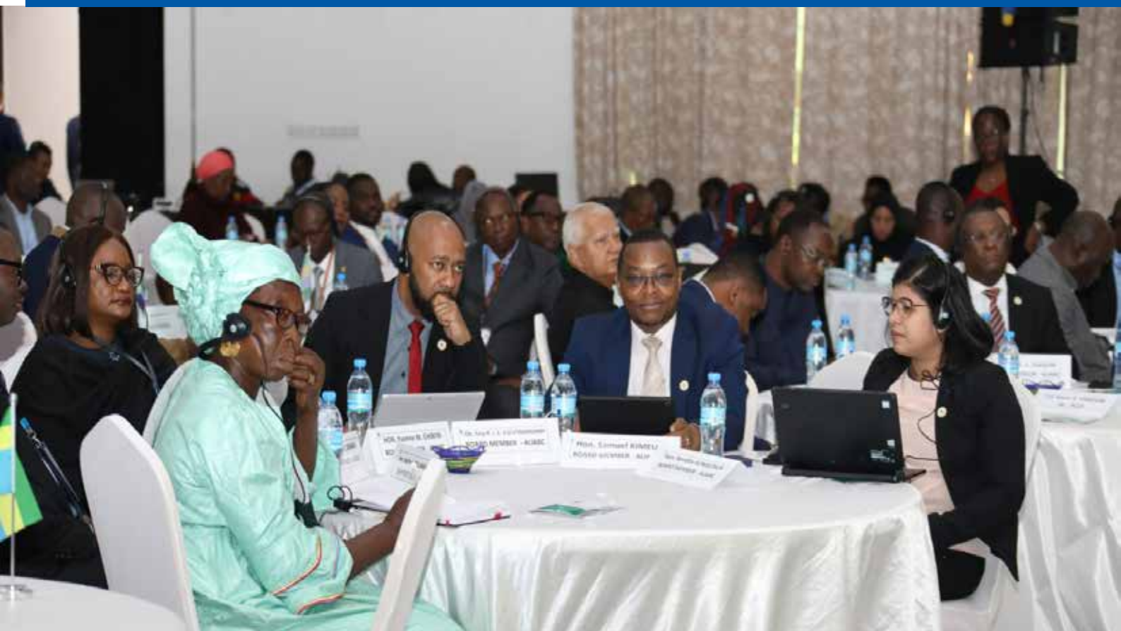
Baadhi ya washiriki wakifuatilia majadiliano katika Kongamano la maadhimisho ya Siku ya Mapambano Dhidi ya Rushwa barani Afrika katika ukumbi ukumbi wa Lake Nyasa wa AICC jijini Arusha Julai 10, 2023.