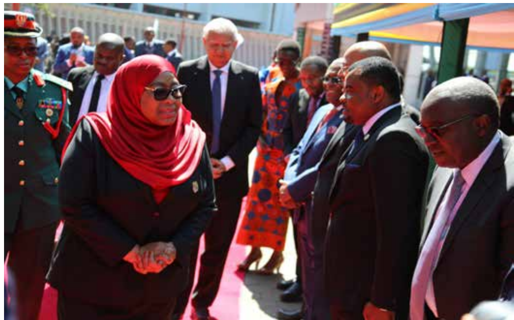
Rais wa Jamhuri ya Muungano wa Tanzania Mhe. Dkt. Samia Suluhu Hassan akisalimiana na Viongozi mbalimbali mara baada ya kuwasili AICC jijini Arusha wakati wa kilele cha maadhimisho ya Siku ya Mapambano Dhidi ya Rushwa barani Afrika Julai 11, 2023.

Maadhimisho haya yalianza Julai 9, 2023 na kufikia kilele Julai 11, 2023 yakiambatana na kaulimbiu inayosema: ‘Mafanikio baada ya Miaka 20 ya Utekelezaji wa Mkataba wa Umoja wa Afrika wa Kuzuia na Kupambana na Rushwa na Matarajio Yake’ 🇹🇿.