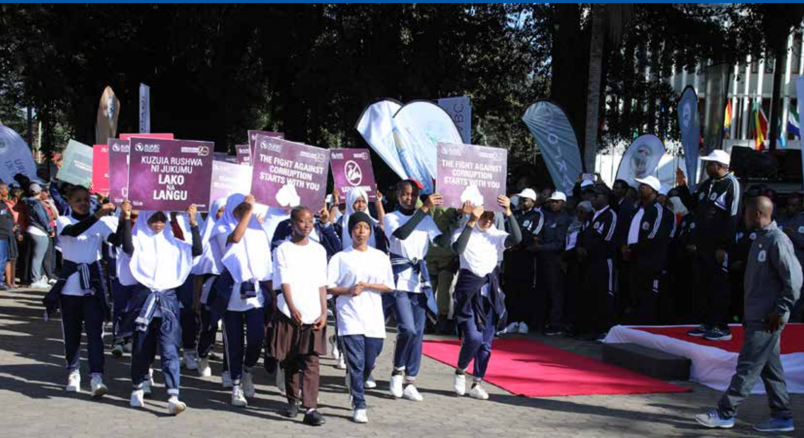
Makamu wa Pili wa Rais wa Zanzibar Mhe. Hemed Suleiman Abdulla (kulia katika jukwaa) akipokea wadau wa mapambano dhidi ya rushwa waliobeba mabango yenye ujumbe wa kuhamasisha mapambano dhidi ya rushwa walioshiriki matembezi ya kupinga rushwa ikiwa ni sehemu ya ufunguzi wa maadhimisho ya Siku ya Mapambano Dhidi ya Rushwa barani Afrika jijini Arusha Julai 9, 2023