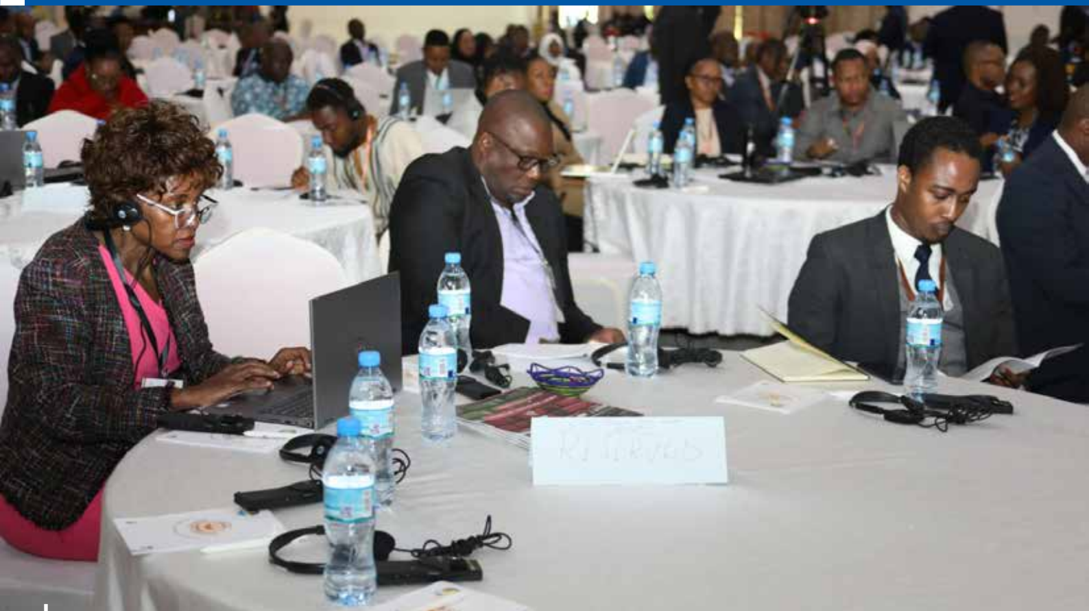
Baadhi ya washiriki wakifuatilia majadiliano katika kongamano la maadhimisho ya Siku ya Mapambano Dhidi ya Rushwa barani Afrika katika ukumbi wa Lake Nyasa wa AICC jijini Arusha Julai 10, 2023.