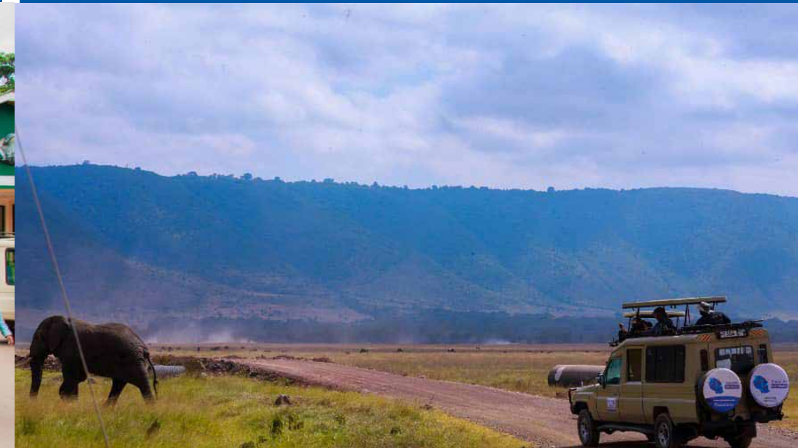
UZURI WA TANZANIA HIFADHINI: Baadhi ya washiriki wa maadhimisho ya Siku ya Mapambano Dhidi ya Rushwa barani Afrika wakimtazama tembo katika Hifadhi ya Taifa ya Ngorongoro, mkoani Arusha Julai 13, 2023.