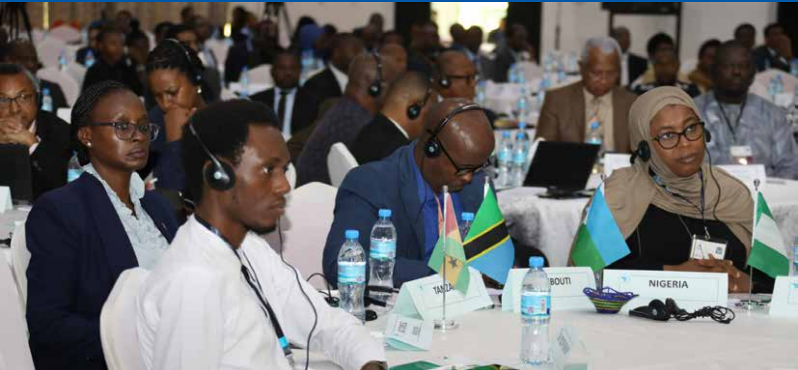
Baadhi ya washiriki wakifuatilia majadiliano katika Kongamano la maadhimisho ya Siku ya Mapambano Dhidi ya Rushwa barani Afrika katika ukumbi wa Lake Nyasa wa AICC jijini Arusha Julai 10, 2023