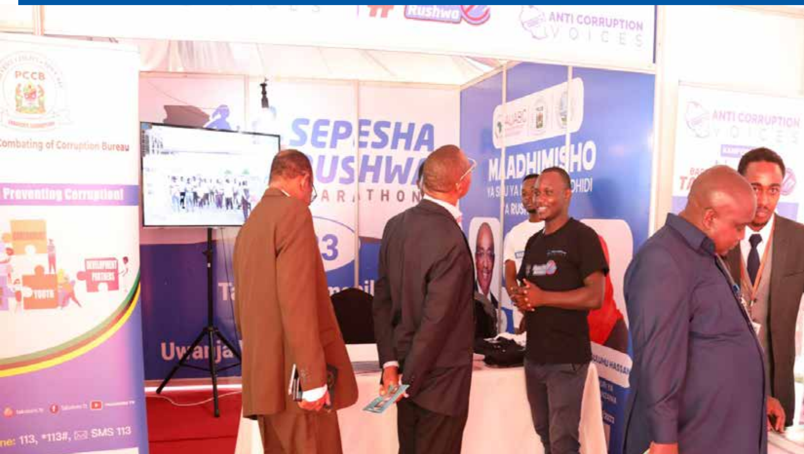
Wadau wa mapambano dhidi ya rushwa wakitembelea banda la Anti - Corruption Voices Foundation (ACVF) kwenye maonesho ya maadhimisho ya Siku ya Mapambano Dhidi ya Rushwa barani Afrika Julai 10, 2023.